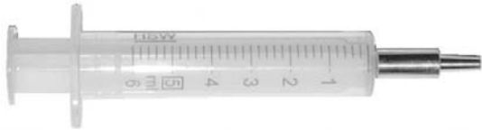
5 ml Polyethylen Spritze, mit Metallkappe