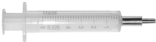
5 ml Polyethylen Spritze, mit Metallkappe